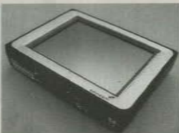
TomTom zoekt een nieuwe richting met ingebouwde systemen.

Je hoeft maar in de file om je heen te kijken om te constateren dat de markt voor losse GPS-systemen snel verzadigd raakt: op de helft van de dashboards prijkt al zo'n navigatiesysteem. Om de moordende concurrentie enigszins voor te blijven moet de Nederlandse navigatiekoning TomTom met iets nieuws op de proppen komen. In plaats van de poor mans navigation die met zuignap aan de autoruit bevestigd worden, zoekt TomTom z'n heil in ingebouwde navigatie-